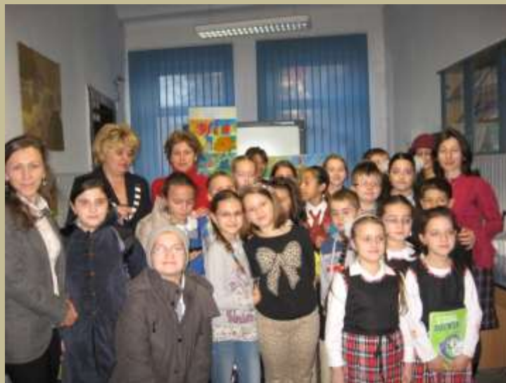
Material realizat de bibliotecar Ana Macovei